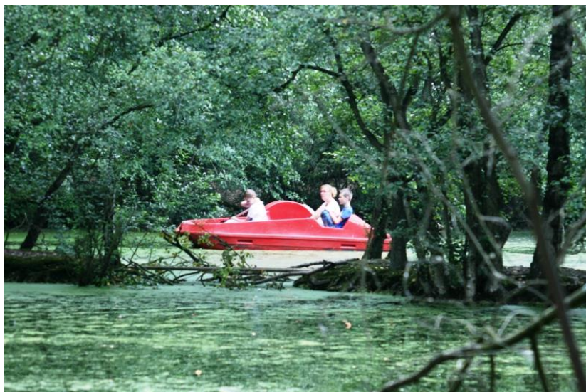
DE LEEMPUTTEN, RECREATIE IN EEN PRACHTIG OUD GEBIED